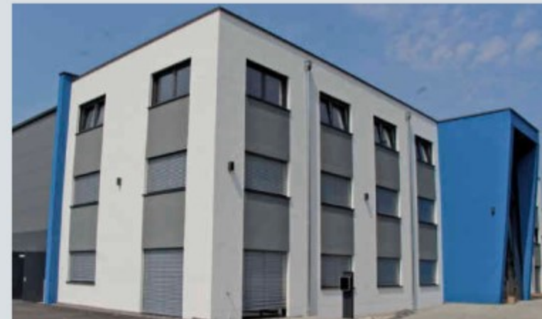
Das neue Gebäude der Firma Wennmacher befindet sich in Erlenbach im Gewerbegebiet »Im Fluß« in der Dr.-Gammert-Straße 7.

Wennmacher hatte seit 1993 seinen Betriebsitz in Obernburg im Industriegebiet »Im Weidig«. Im Juli 2018 feierte das Unternehmen sein 25-jähriges Bestehen.