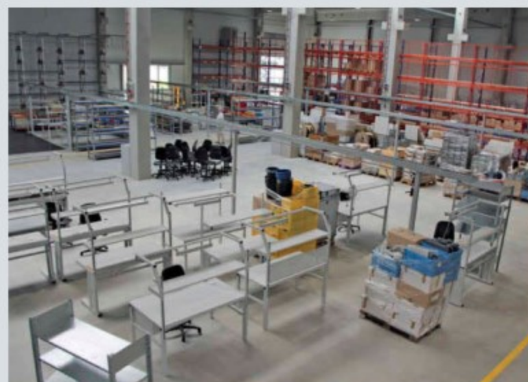
Die neue Halle besitzt 2000 Quadratmeter Produktions- und Lagerfläche sowie 700 Quadratmeter Bürofläche.