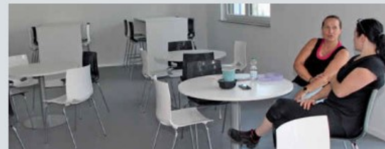
In der Teeküche können die Mitarbeiter ihre Pausen verbringen.